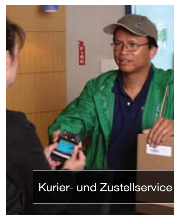
Kurier- und Zustellservice